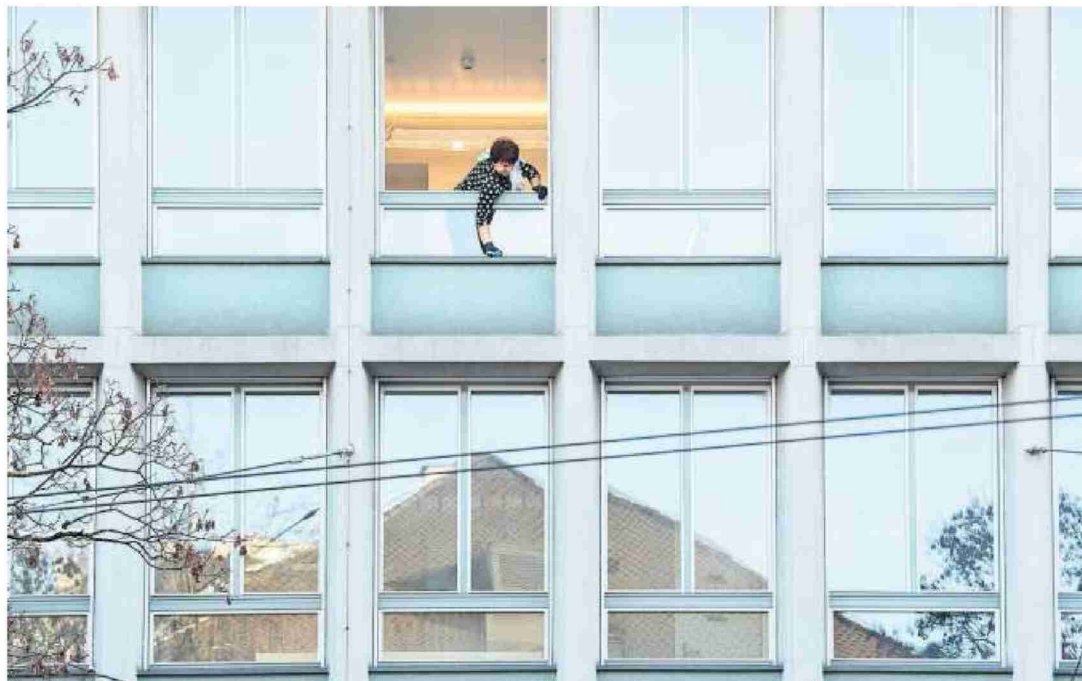
Schon bald werden in Luzern grössere Büroflächen frei.